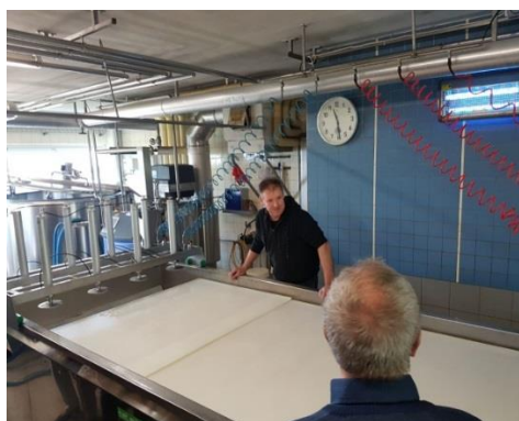
Besuch in der Käserei – wie andächtig die alle zusehen!