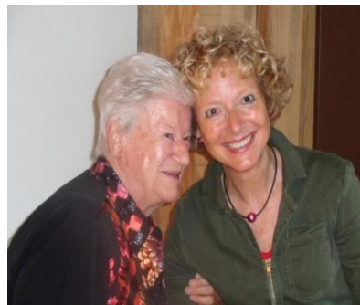
Die Präsidentin mit Tochter