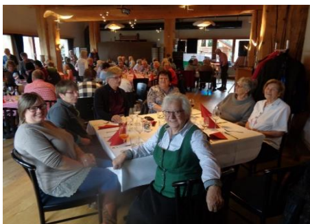
A schöne Runde